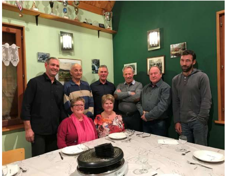
manque Didier Gastebois sur la photo

Notre traditionnel « Bœuf à la broche » a une nouvelle fois été une grande réussite.