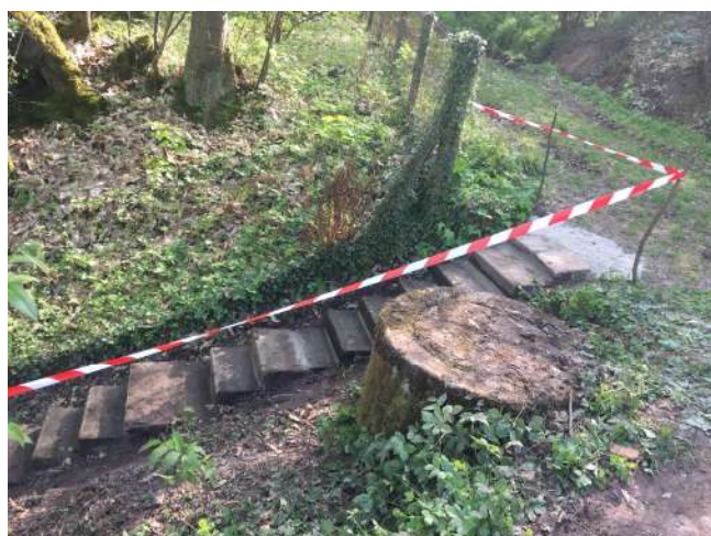
Rénovation escalier Passage « cimetière »