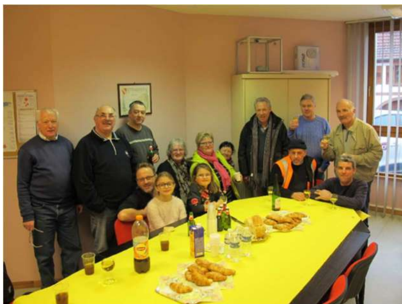
Partage du verre de l'amitié