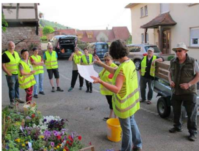
Répartitions des fleurs par massif