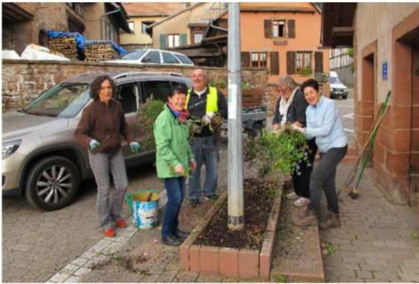
Arrachage des plantations d'été