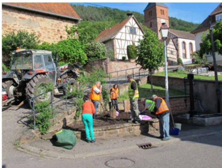
Préparation de la terre