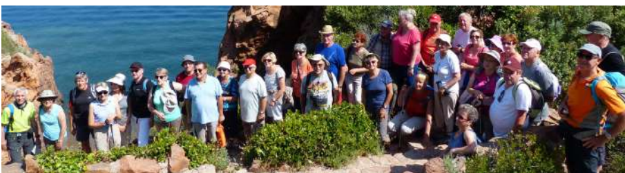
Sortie à Théoule

Changement d'horizon radical avec une excursion mémorable au bord de la méditerranée : ;des paysages magnifiques, un climat fort agréable permettant la baignade et des ballades pittoresques dans le pays de Cannes , laisseront de beaux souvenirs à la quarantaine de participants.