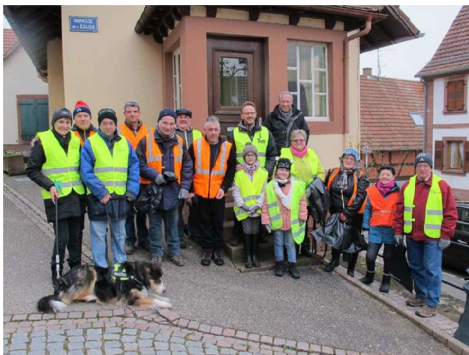
Avant la collecte

En fin de matinée, tout le monde s'est retrouvé à la mairie pour le verre de l'amitié offert par la municipalité.