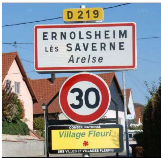
Nouveaux panneaux d'entrée du village