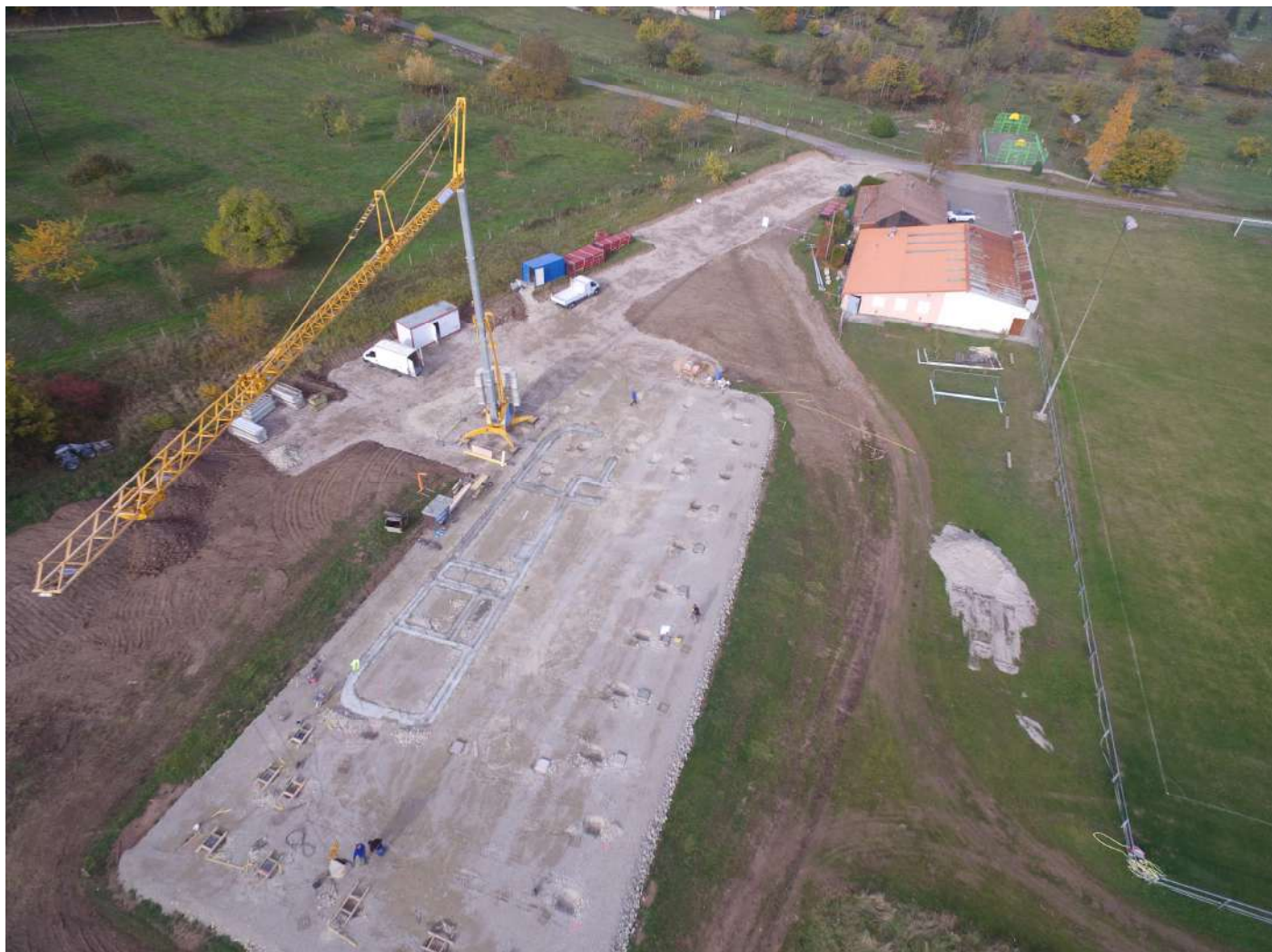
VUE AERIENNE DU CHANTIER DE LA SALLE COMMUNALE